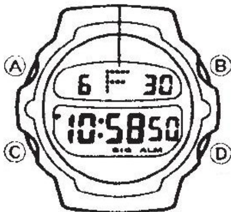
РЕЖИМ ТЕКУЩЕГО ВРЕМЕНИ

В этом режиме нажмите кнопку “D” для переключения между 12- и 24-часовым форматом. В 12-часовом формате анимационный дисплей показывает текущий день недели. В 24-часовом формате он показывает маркер G.