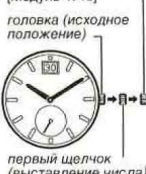
головка (исходное положение)