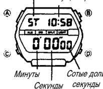
Индикатор текущего режима

Режим секундомера дает вам возможность измерять отдельные отрезки времени, промежуточное время, а также фиксировать два первых результата в соревнованиях. Максимальный диапазон измеряемого секундомером времени составляет 23 часа 59 минут 59.99 секунд.