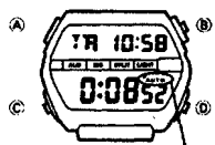
Индикатор подключения функции автоматического повтора